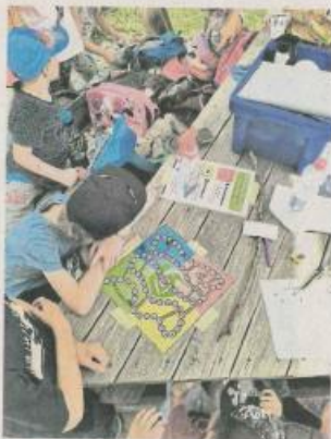
„Volle Molle von der Rolle“ hieß es bei den Spielenachmittagen.

■ Hunsrück. „Endlich wieder (R)Austoben!“ – so lautete das Motto des Treffmobils, um dem „digitalen Overload“ der vergangenen Monate entgegenzuwirken und Kindern die Möglichkeit zu bieten, sich endlich wieder draußen mit Gleichaltrigen zu treffen, gemeinsam zu spielen und sich auszutoben. Treff-Mobil beschreibt die Idee dahinter so: „Wir fahren in die Dörfer, auf den Spiel-/Sportplatz oder zu Ähnlichem im Freien und veranstalten ein verrücktes Chaosspiel für Kinder. Beim Chaosspiel geht's mit jeder Menge Spaß, Bewegung und Teamgeist zur Sache! Hierbei spielen mehrere Kleingruppen gegeneinander und müssen gemeinsam und schnellstmöglich verschiedene Aufgaben lösen, da das schnellste Team gewinnt.“ Die Nachfrage sei enorm groß gewesen während der Ferien. So konnten im geplanten Zeitraum von zwei Wochen zunächst nur sieben Termine