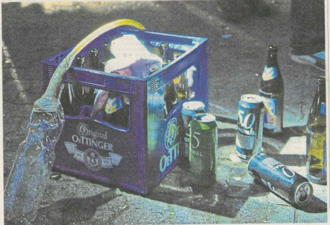
Immer mehr Kinder und Jugendliche feiern aufgrund der Corona-Beschränkungen illegale Partys oder treffen sich auf Parkplätzen, um dort Alkohol und Drogen zu konsumieren. Mit „Aufsuchender Arbeit“ versuchen Hunsrücker Sozialarbeiter, die jungen Menschen zu erreichen.